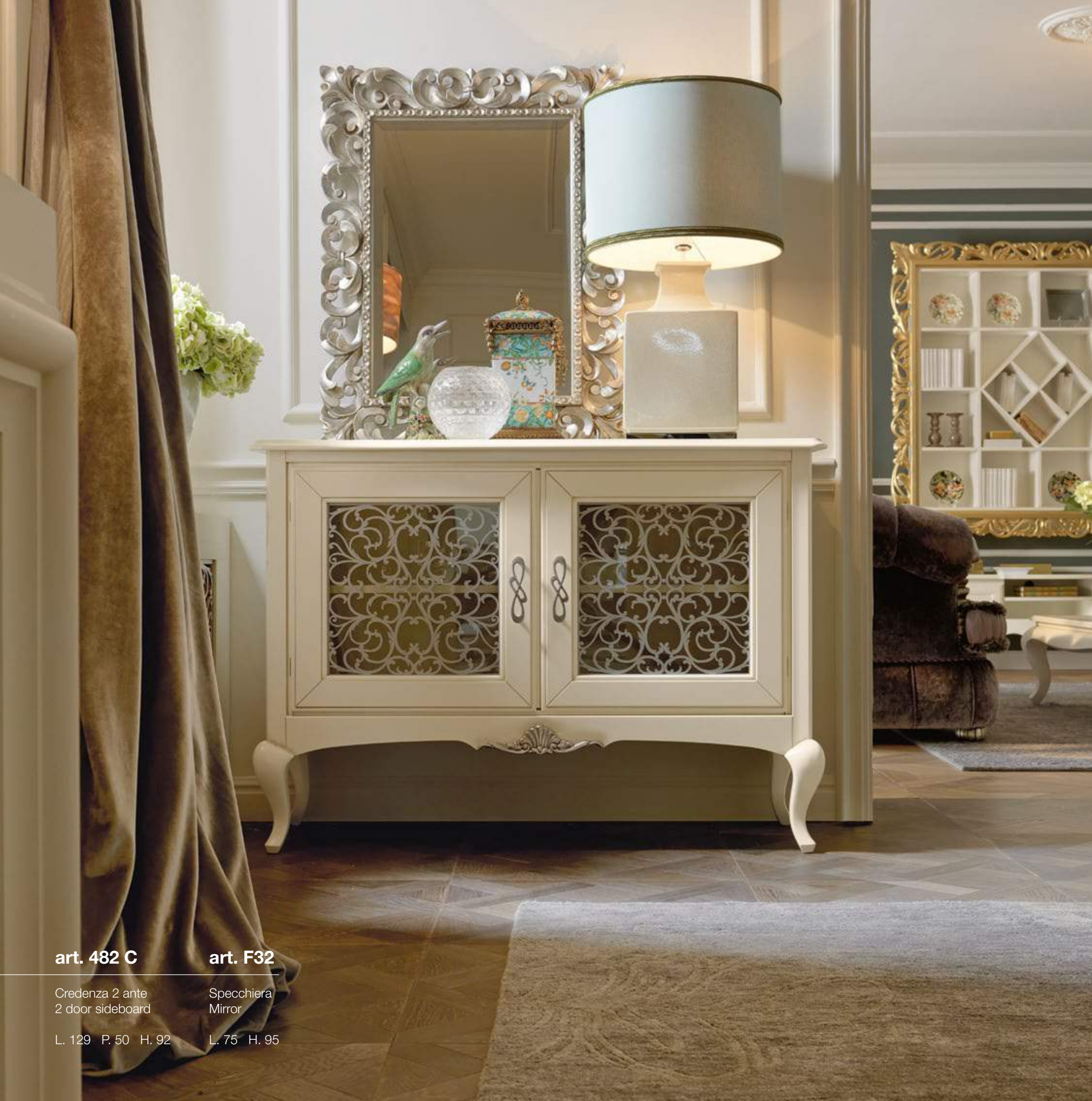
art. 482 C