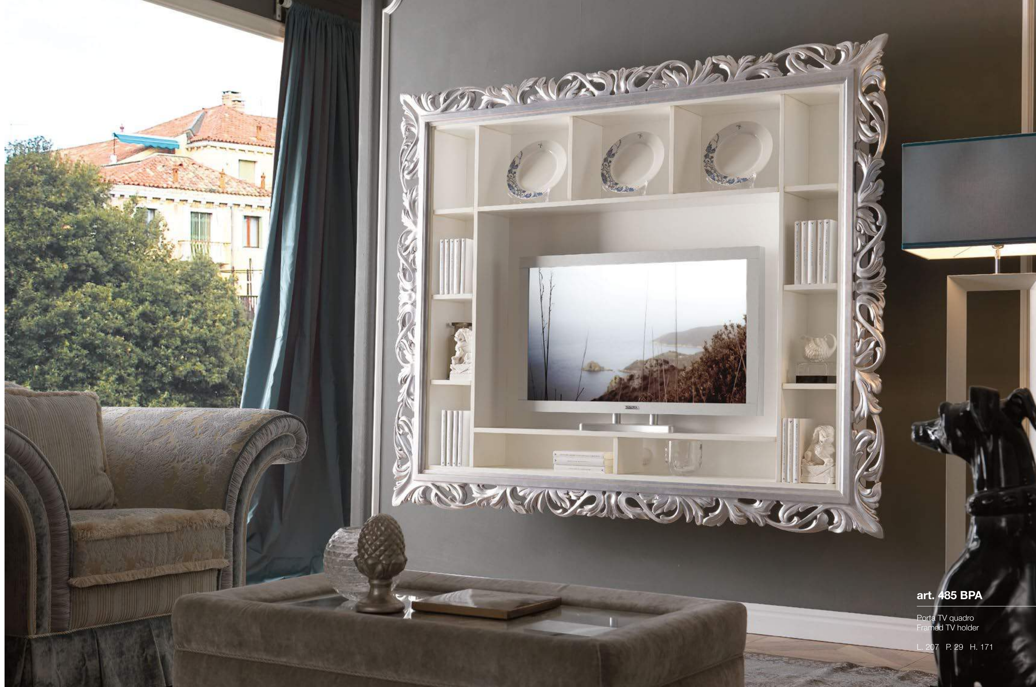
art. 485 BPA

Classical style is revived and reinterpreted in a contemporary fashion. The framed TV holder fits into this furnishing project, where design and creativity are developed into solutions with a fresh, contemporary taste.