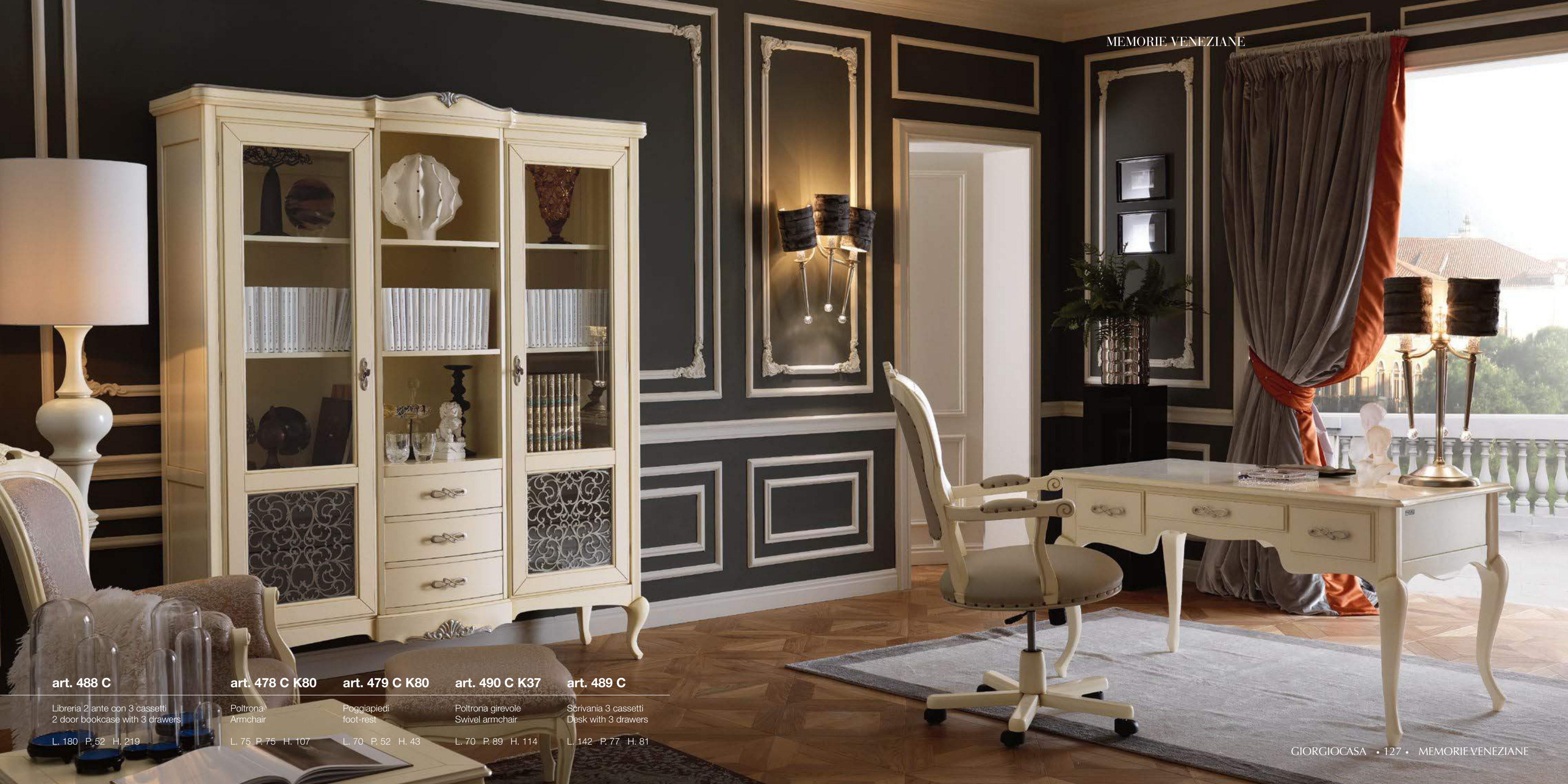
art. 488 C

Libreria 2 ante con 3 cassetti 2 door bookcase with 3 drawers