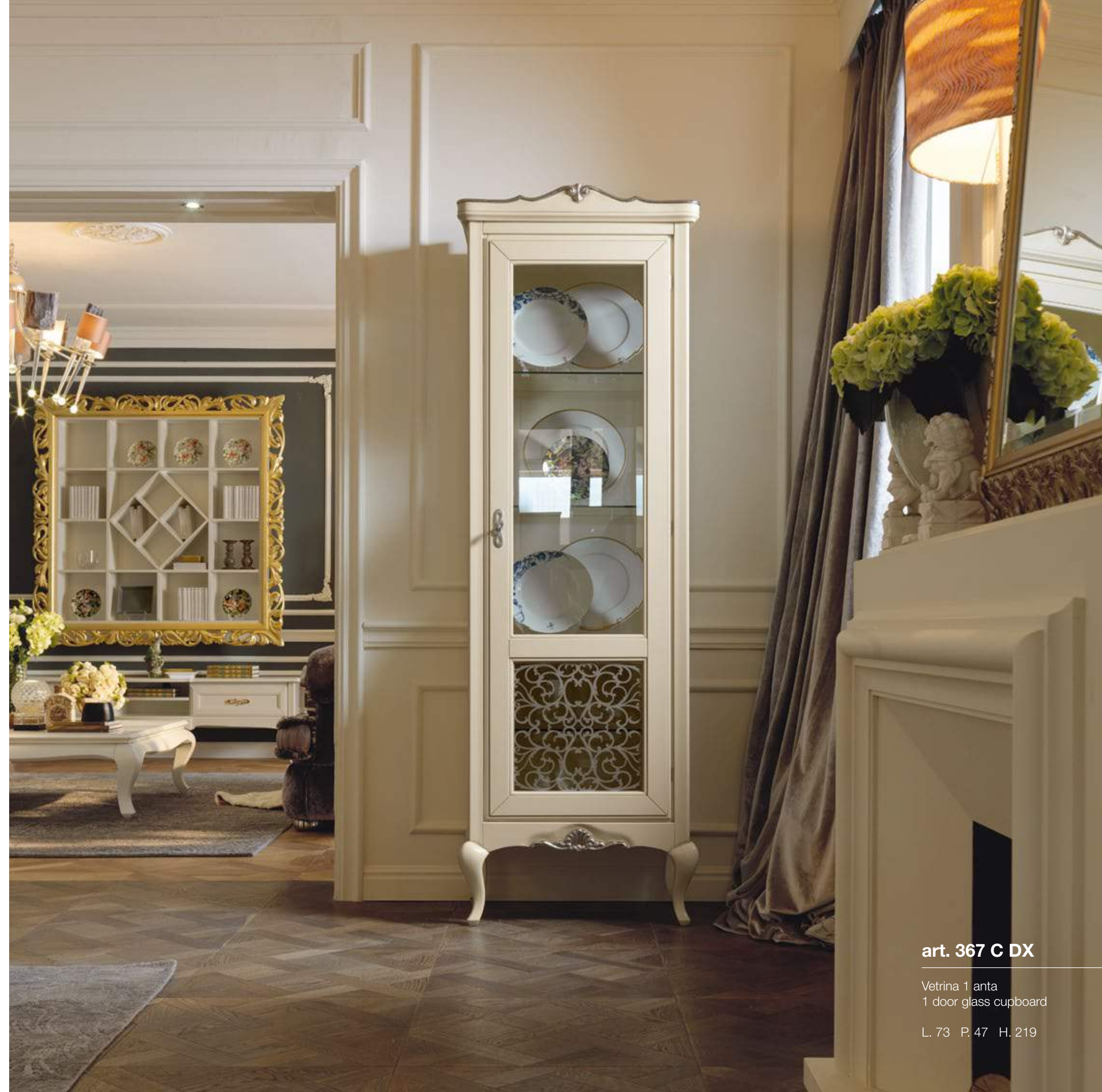
art. 367 C DX