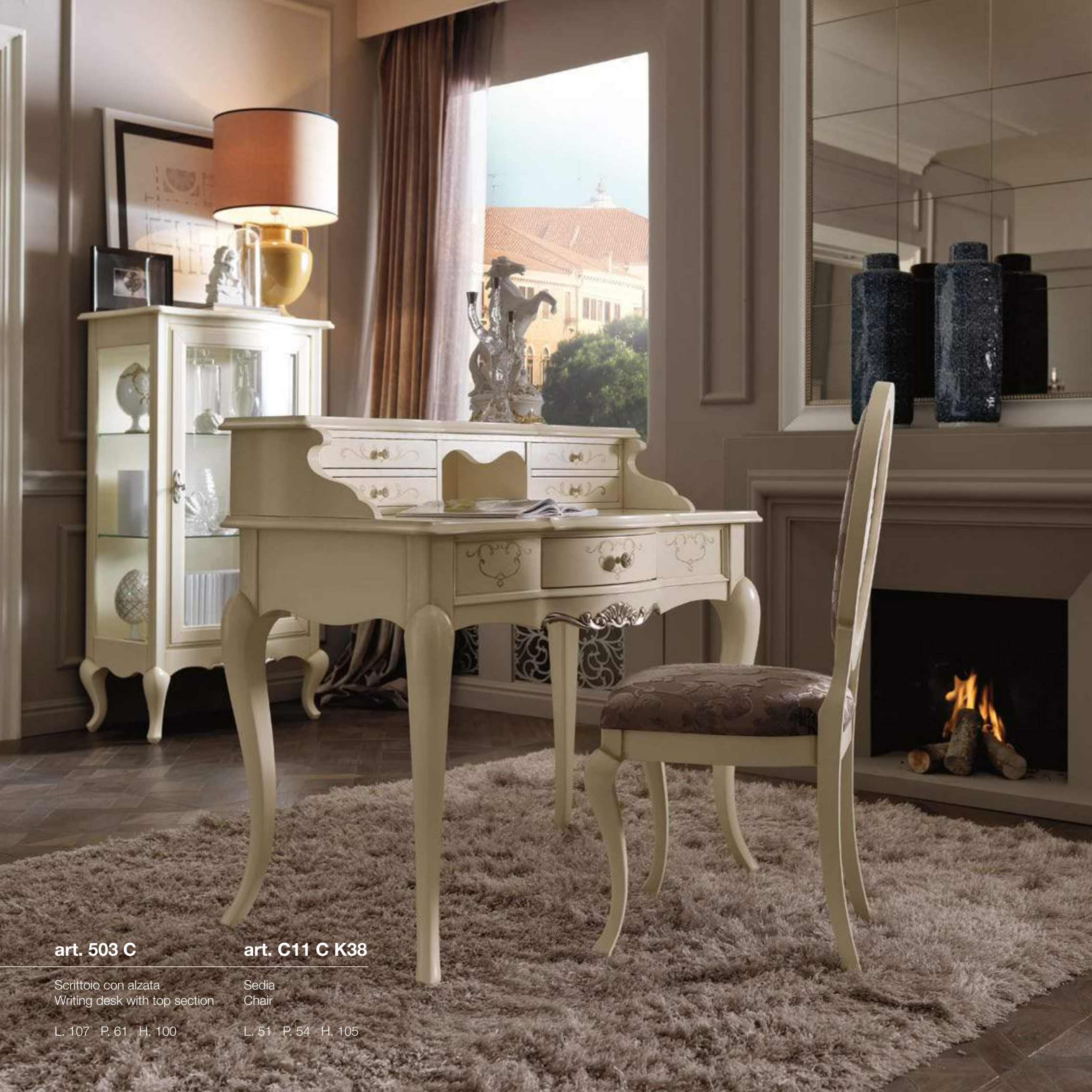
art. 503 C

Scrivitoio con alzata Writing desk with top section