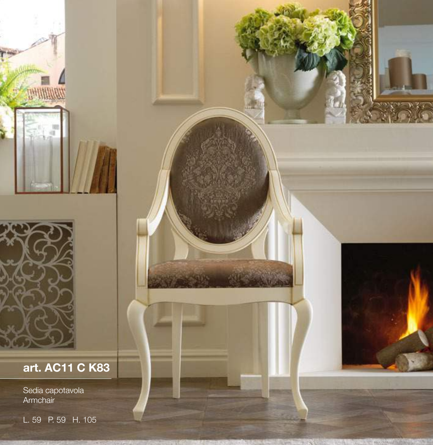
art. AC11 C K83