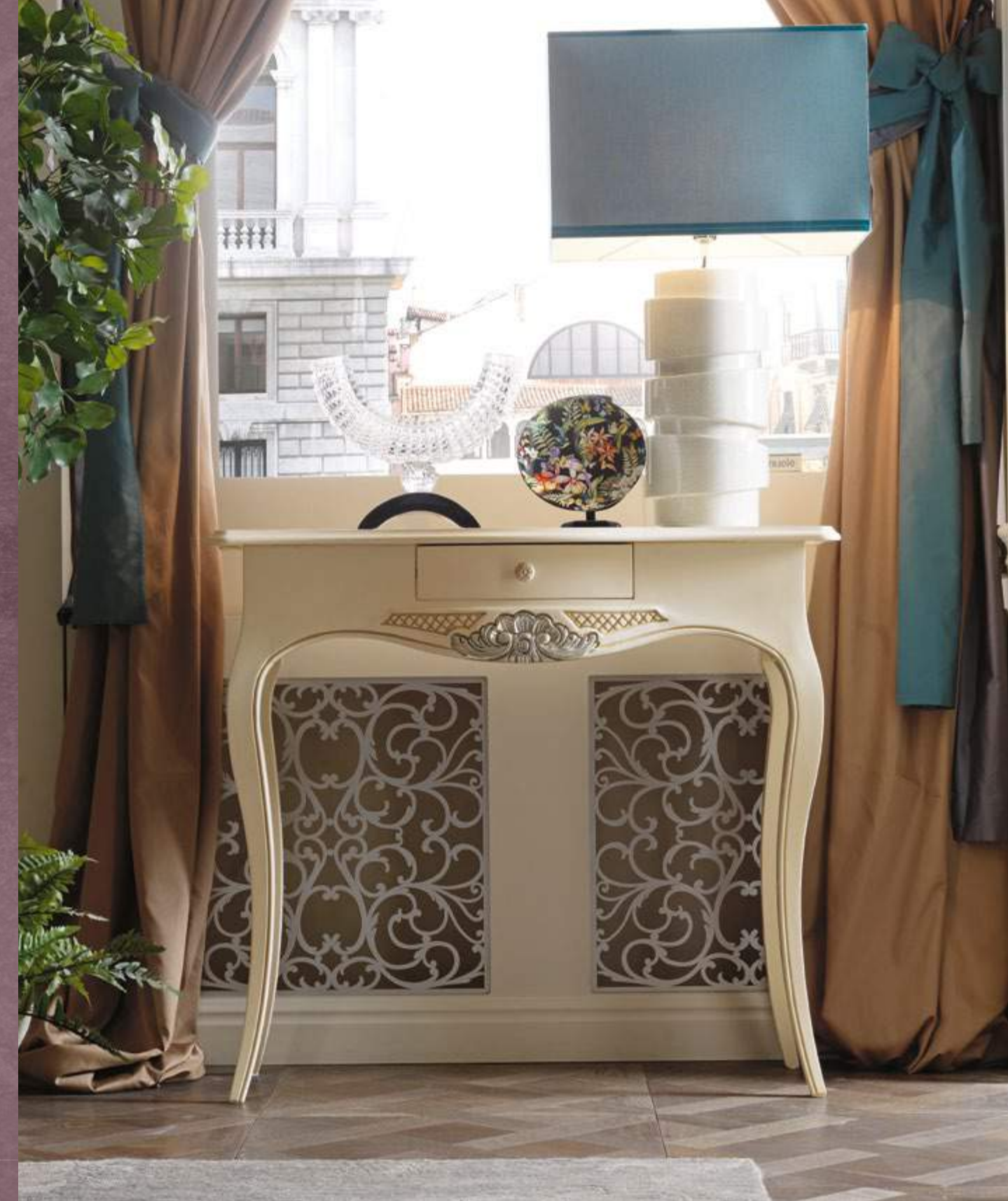
art. 461 C

An elegant mirror abuts on a two-door sideboard with its classy and harmonious features. On the other side, a console table with a central drawer is lit by a lamp with a geometrical lampshade and a base with contemporary design.