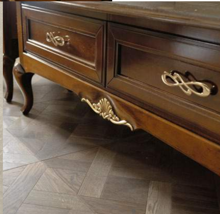
art. 451Y P

Wood combined with gold plays a leading role in this typically classical and refined living area. The coffee table has distinctive and unpredictably sober lines.