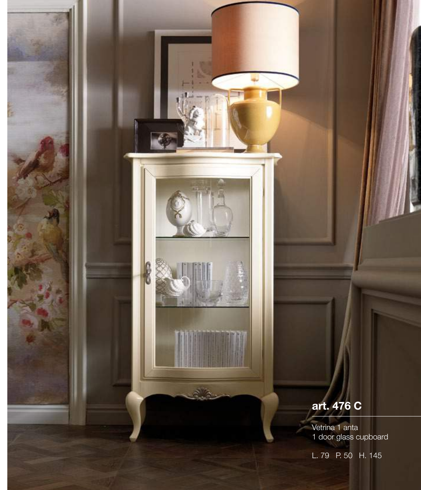
art. 476 C

The collection is topped up by exclusive and refined furnishing elements, such as an exquisite writing desk with a hutch on top with four storage drawers. The one-door showcase can be a perfect storage compartment for artistic glassware and silverware.